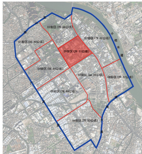
规划范围在东区片区的位置示意图