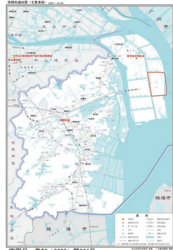
东三-东四围片区在翠亨新区的位置

本次调整范围位于中山翠亨新区起步区东三-东四围片区（1927单元）04街区，街区面积共60.92公顷，调整范围面积为16.39公顷。