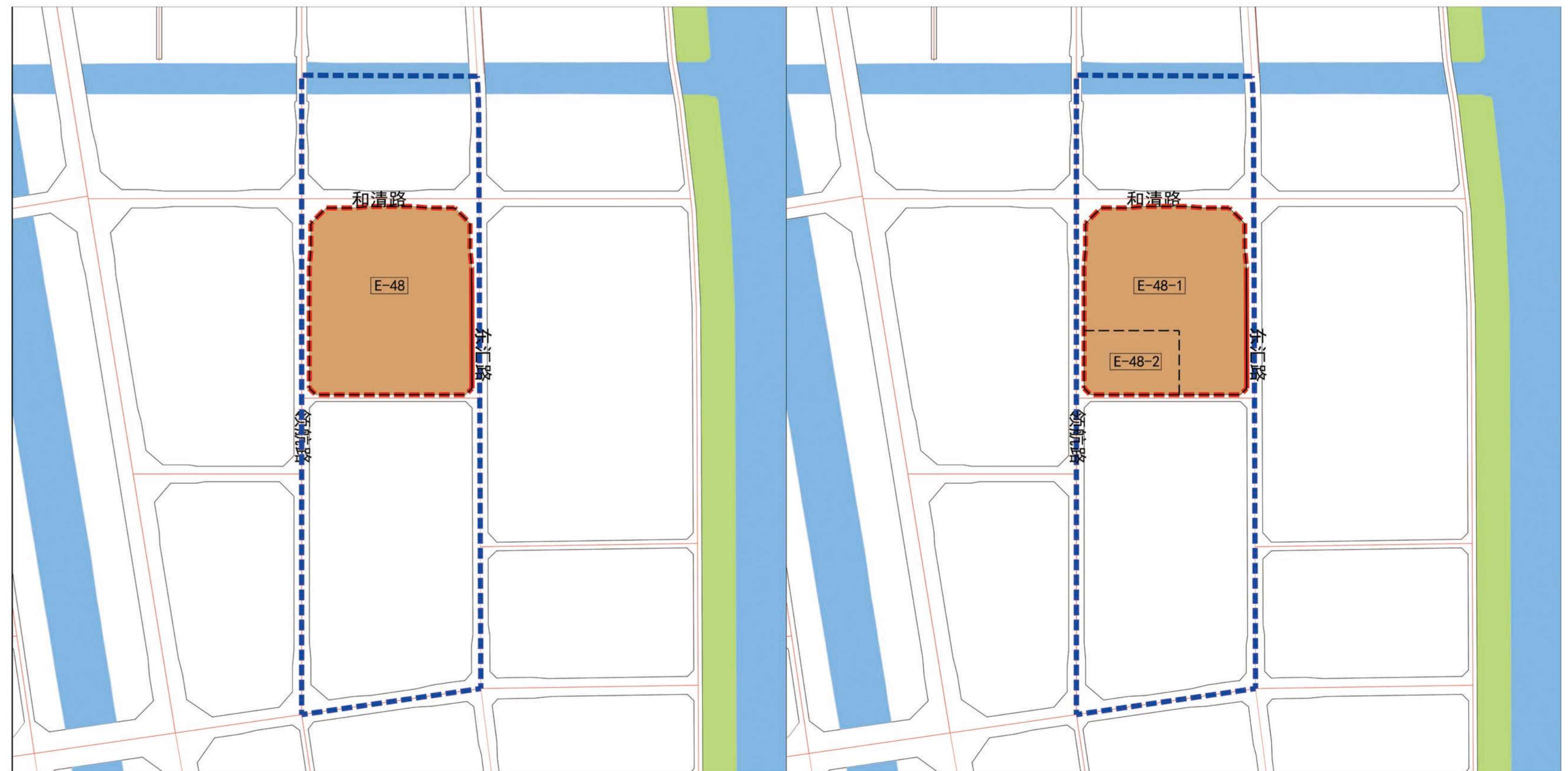
调整前用地规划图

本次调整结合片区发展需求，拓展产业发展空间，积极响应管委会关于提高土地集约利用、促进产业集聚升级的规划导向，在符合园区发展的前提下，将E-48地块拆分为E-48-1、E-48-2两个地块，并提高E-48-2地块容积率至4.0；同时按照《中山市国土空间规划技术标准与准则（2023版）》规范及相关要求，调整E-48-1、E-48-2地块的建筑密度、建筑高度及海绵城市等指标。