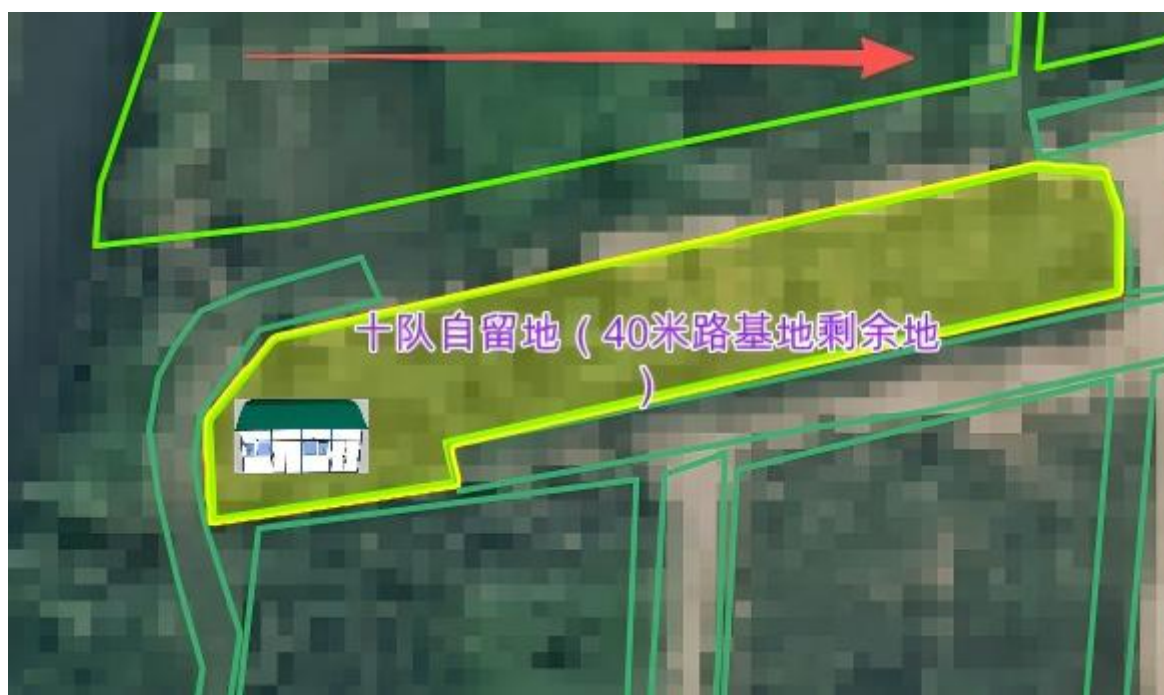
图 2. 位置朝向示意图