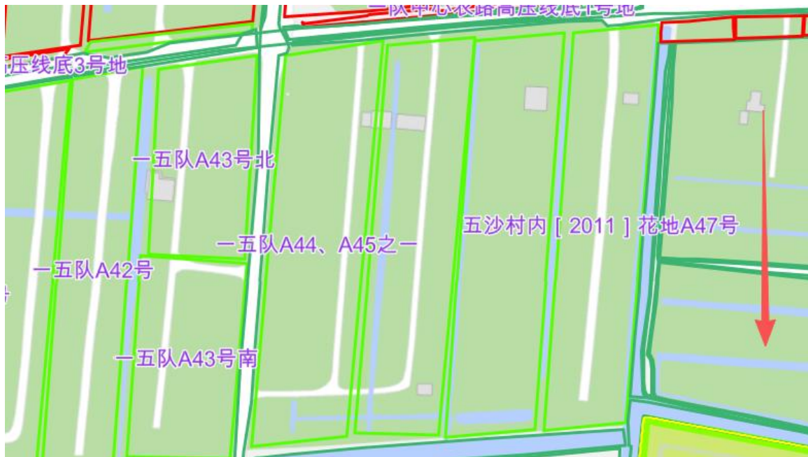
图 2. 位置朝向示意图