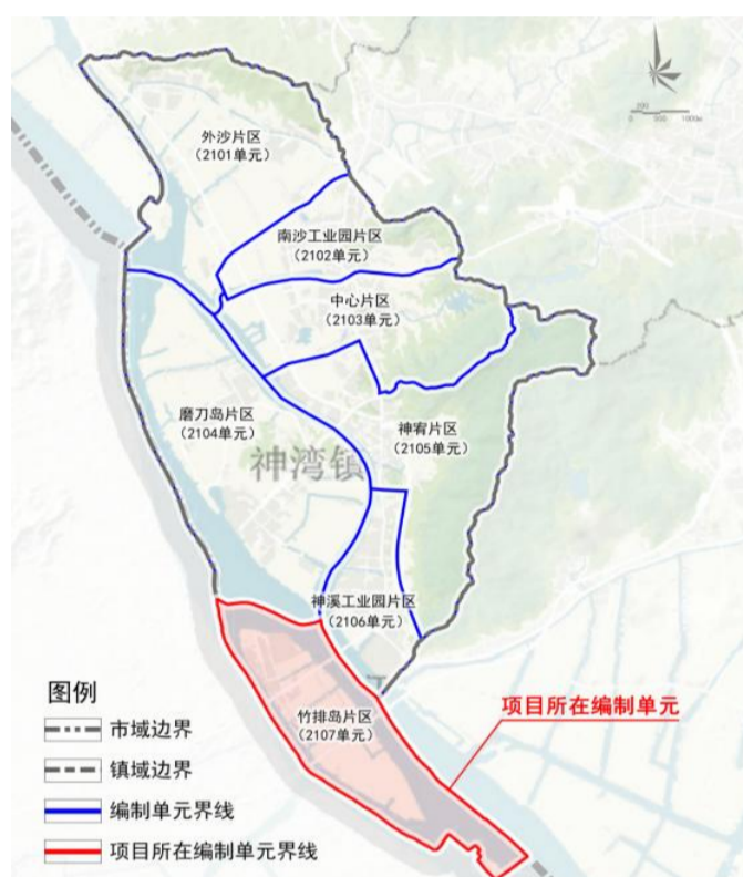
竹排岛片区(2107单元)在神湾镇的位置

工业用地地块指标在符合《中山市国土空间规划技术标准与准则(2023版)》要求基础上，规划容积率为1.0~3.5，产业用房高度≤50米，配套设施建筑高度≤50米。