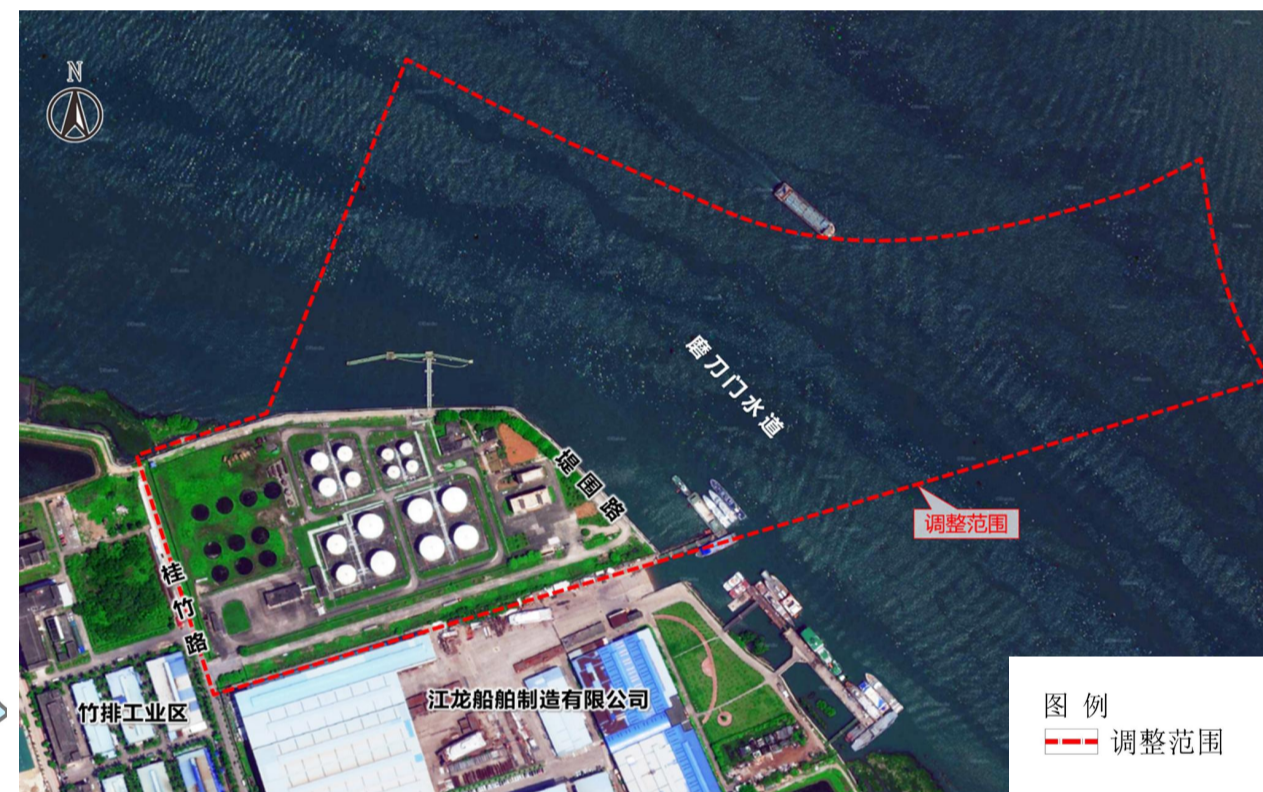
规划调整范围示意图