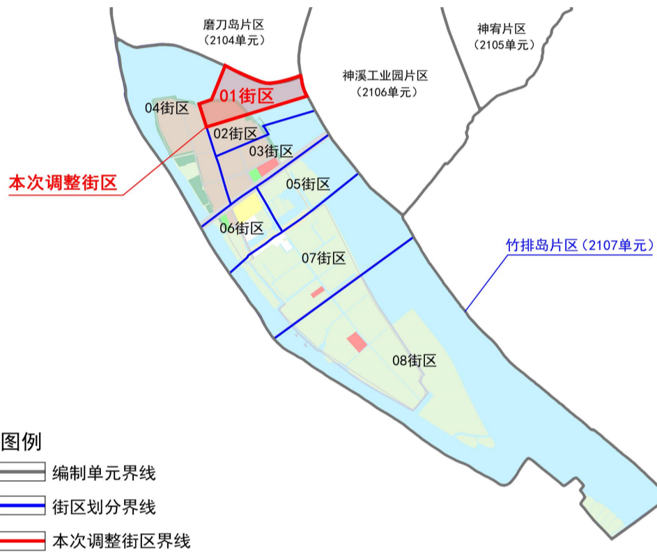
项目在竹排岛片区的位置