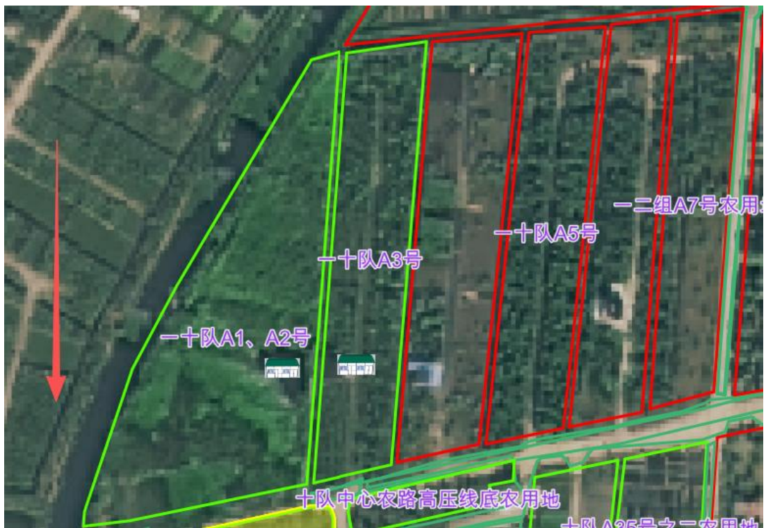
图 2. 位置朝向示意图