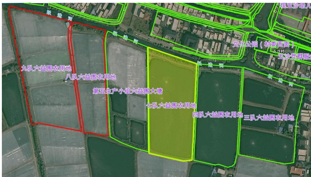
图 2. 位置朝向示意图