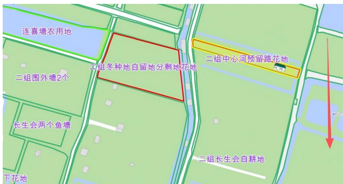
图 2. 位置朝向示意图