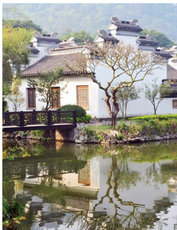
图1 马应彪纪念公园