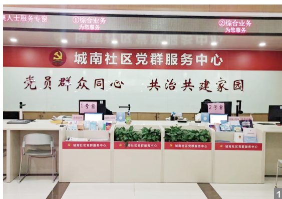
图1 城南社区港澳人士服务专窗

Vaccination Registration Service for Foreigners and Compatriots from Hong Kong, Macao and Taiwan Held in South District