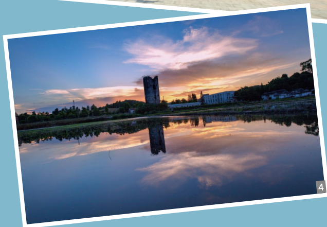
图1 美丽乡村 图2 曹边学校 图3 曹边牌坊小道 图4 曹边碉楼 图5 曹边桥