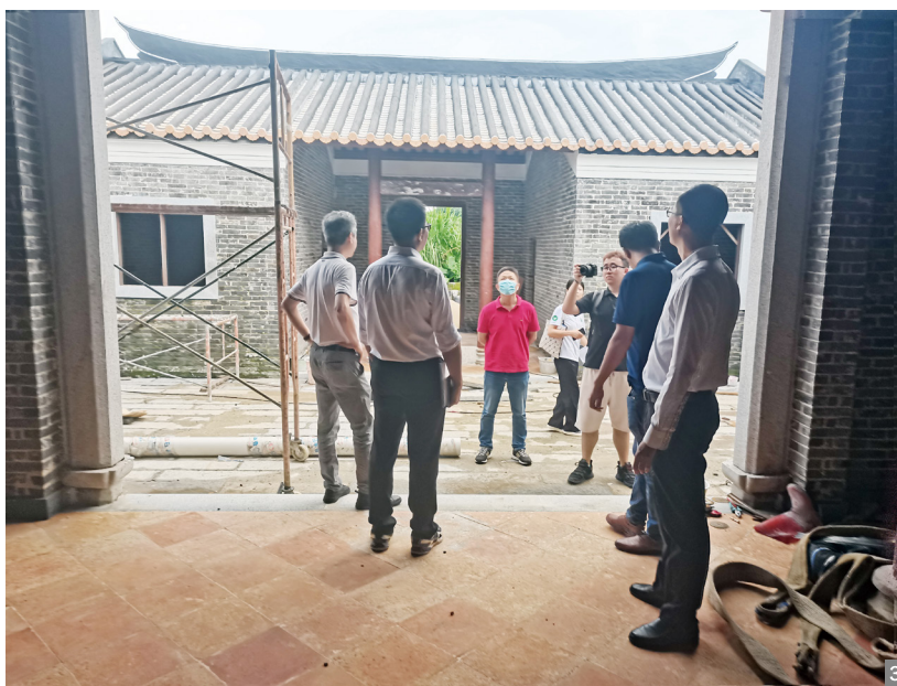
图1 联合工作组考察美丽侨村建设情况