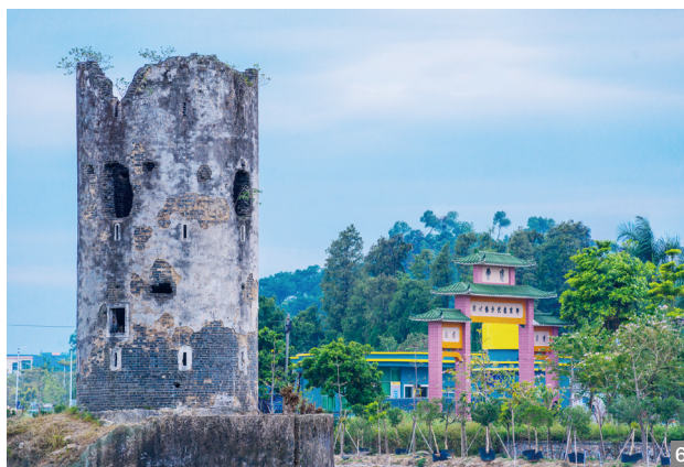
图1 南区街道荣获2021年“中国最美村镇”产业兴旺成就奖 图2 南区街道荣获2021年“中国最美村镇”乡风文明成就奖 图3 三菱电梯 图4 “中国最美村镇”——曹边 图5 曹边学校 图6 曹边碉楼