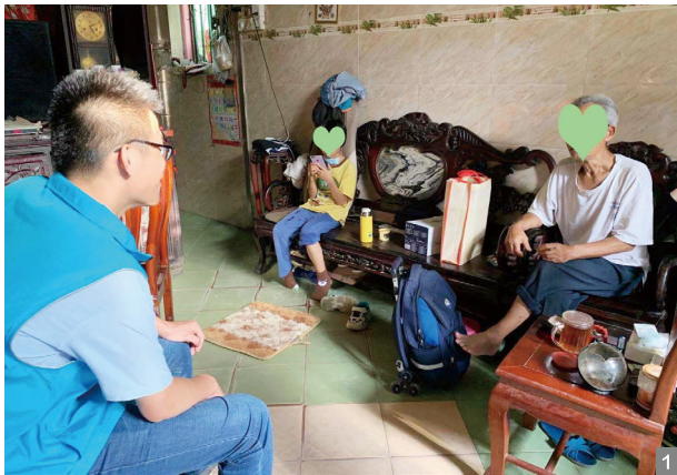
图1 六一慰问残疾及双低儿童