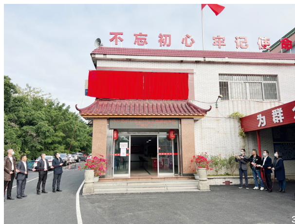
图3 良都社区恒美服务站启用

三级联动党群服务阵地体系。高标准建设1个街道级党群服务中心，规范建设5个社区党群服务中心。构建“5分钟”党群服务生活圈，打通服务群众的“最后一公里”，分别在居住小区、经联社、商圈楼宇、园区市场建设党群服务站点，打造家门口、零距离、接地气的为民服务平台。