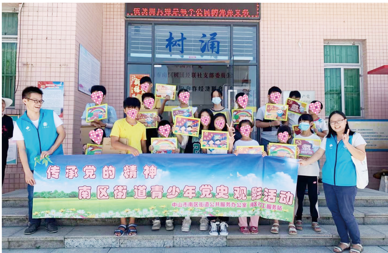
南区街道社工站困境青少年爱国主义教育活动

——South District Makes Every Effort to Escort the Healthy Growth of Minors