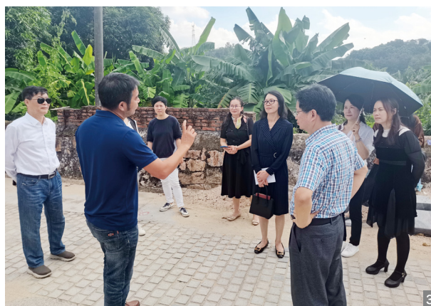
图1 参观中山市第一批华侨学校——曹边学校