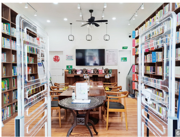
图4 寮后碉楼群 图5 茶道音乐 图6 香山书房