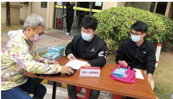
图2 协助外籍人士和港澳台同胞预约登记接种新冠肺炎疫苗

为做好外籍人士及港澳台同胞疫苗接种登记服务工作，12月17—18日，南区街道统战办联合城南社区港澳人士服务中心分别于滨河湾、金水湾小区开展外籍人士及港澳台同胞疫苗接种登记服务活动。