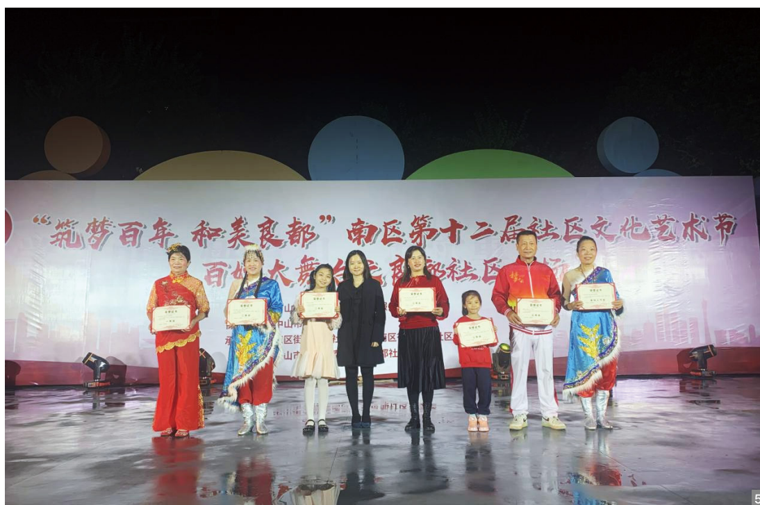
图1 “筑梦百年 和美良都”南区第十二届社区文化艺术节百姓大舞台系列活动上演