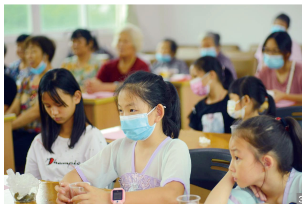
图1 “我们的节日·重阳”：尊老敬老活动暨红色故事会举办