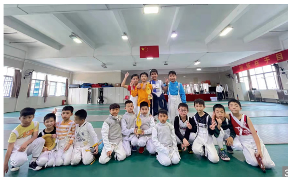
图1 竹秀园小学荣获2021年中山市中小學生击剑锦标赛团体总分第一名