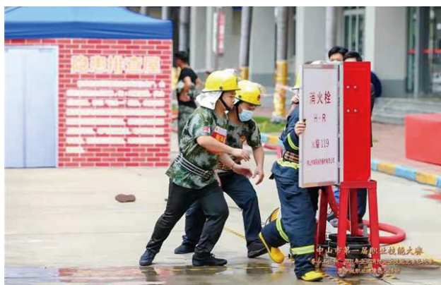
微型消防站队员两盘水带连接

——Skilled Craftsmen from South District Showcase Their Skills