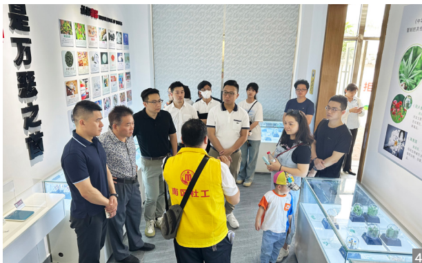
图3、4 青年台胞台属参观禁毒教育基地

总结2022年以来的工作情况，研究2023年工作计划，并颁发有关聘书。肖俊辉会长强调，市台联会青年委员会要把学习宣传贯彻党的二十大精神作为当前和今后一个时期的首要政治任务，积极发动广大青年台胞台属参加市台务局、市台联会组织的学习交流活动；积极拓展多元渠道和载体，发展新会员，不断积聚台联新生力量；善于借助各方资源，搭建更多交流协作平台，持续扩大市台联会青年委员会的影响力。