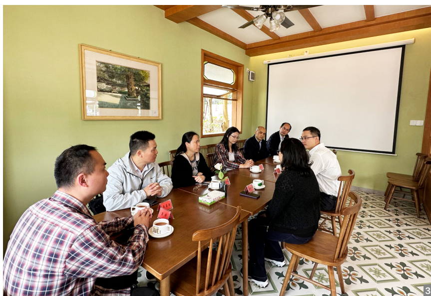
图1 调研组一行参观良都侨苑 图2 调研组一行参观南区方志馆 图3 调研座谈会现场