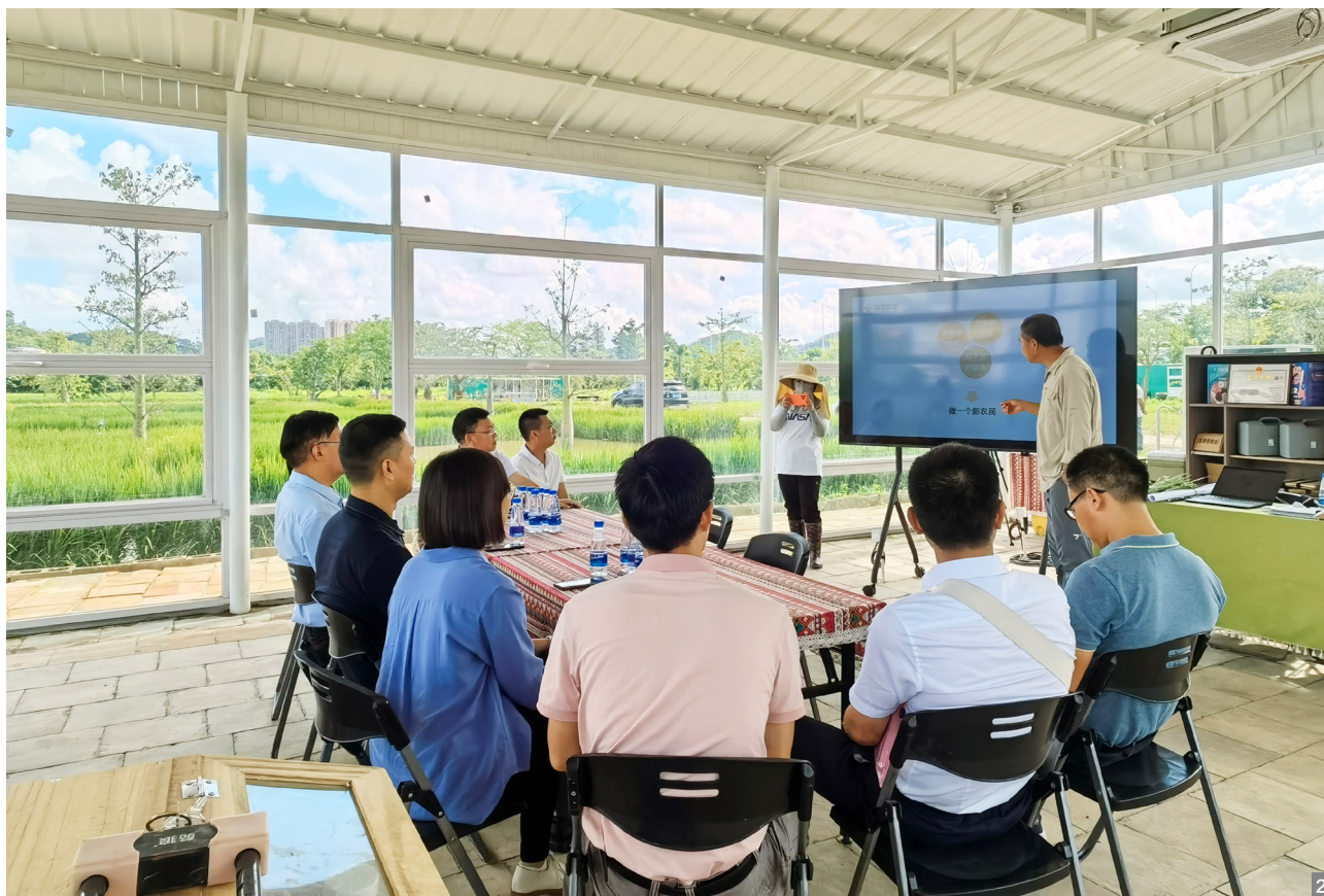
图1 视察乡村振兴情况