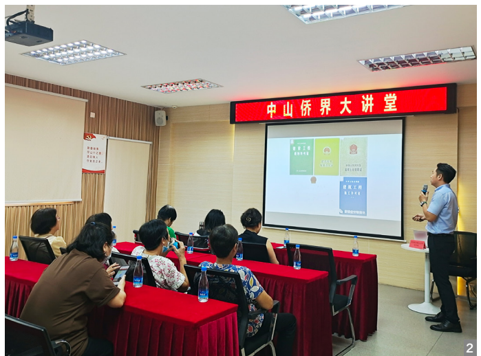
图1、2 南区侨联举办侨界大讲堂法律知识专题讲座

6月29日，中山市侨联和南区侨联在南区街道党群服务中心举办2023年第5期中山侨界大讲堂，进一步提高侨界群众防范法律风险的能力。