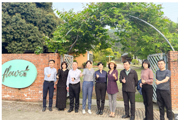
图4 迁安考察团参观南区文笔山大风车生态园“心荟然学”