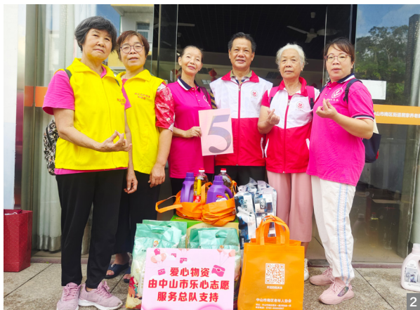
图1 端午节敬老扶弱慰问活动合影