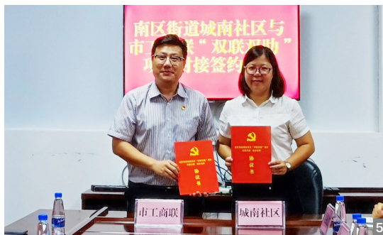
图1 环城社区召开“双联双助”党建联席会议 图2 党员干部走访调研快递站点，了解暖“蜂”服务真实需求 图3 良都社区开展共筑花“箱”四溢美丽良都文明创建活动 图4 城南社区开展“六一”儿童节关爱活动 图5 城南社区与市工商联举行项目对接签约仪式