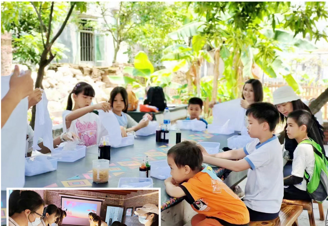
图1 逸境小筑“文化馆之友”