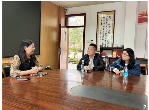
图1 广东清匠电器有限公司党支部结对助学仪式现场 图2 为助学对象送上书籍和中山市奕翔鞋业有限公司捐赠的童鞋 图3 北溪社区干部现场讨论工作情况