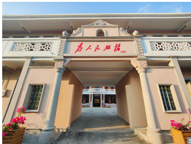
图2、3 沙涌历史文化街区