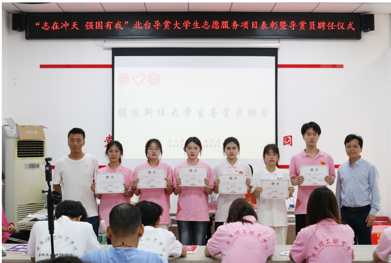
图1 青年志愿导赏员带游北溪