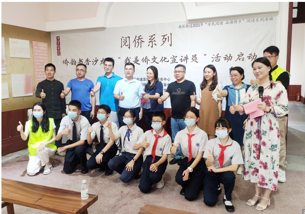
图1 “全民阅读 品读侨乡”阅读系列活动之侨韵书香沙龙暨“我是侨文化宣讲员”活动现场