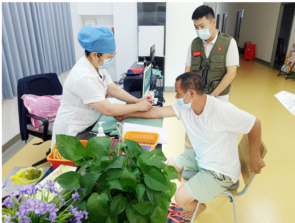
南区街道组织开展重点 优抚对象免费体检活动

Genuine Care for Entitled Groups, Warmth in Health Examinations