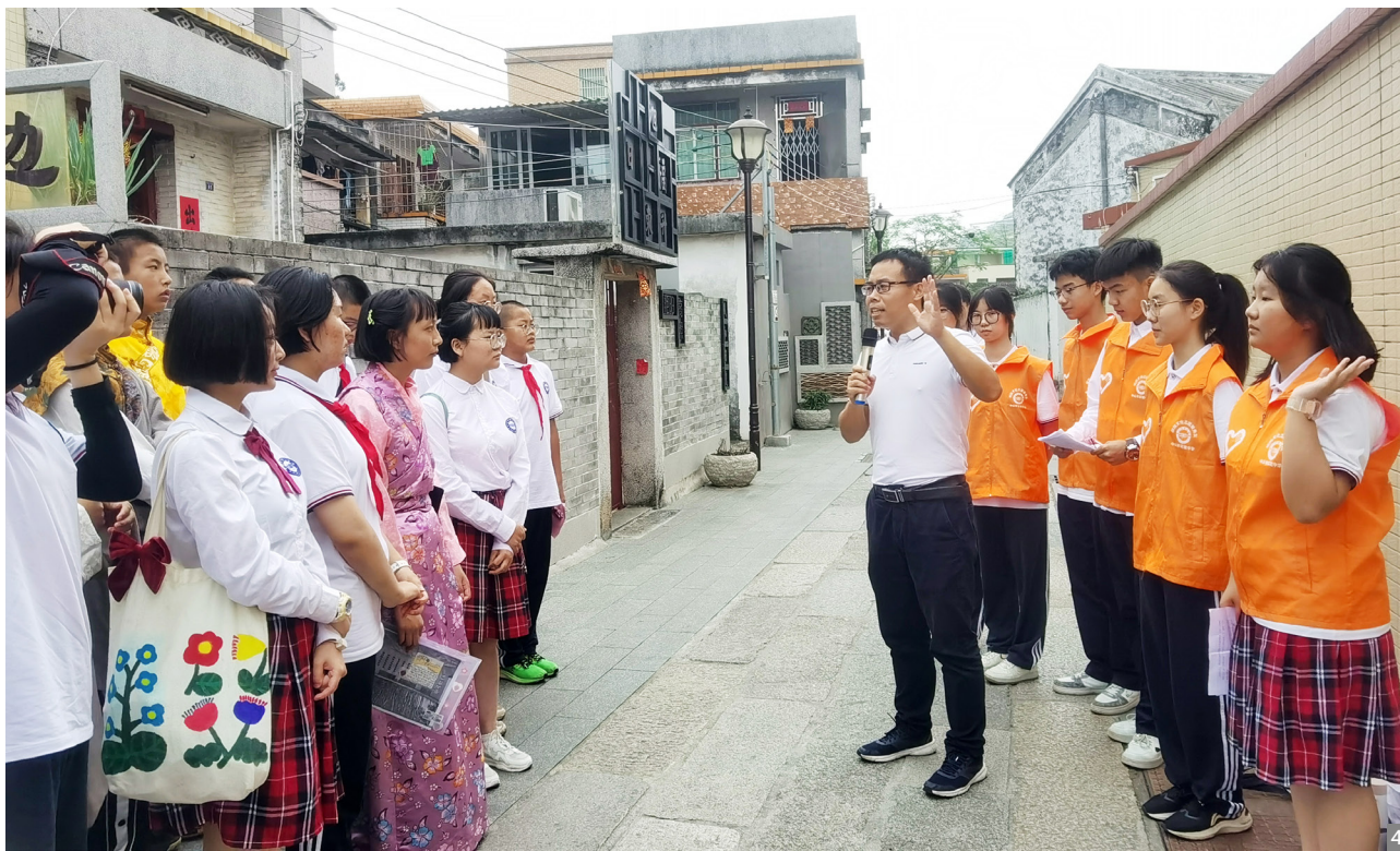
图1 “阅读乡村·行走侨乡——我们都是石榴籽 同心共筑中国梦”阅读分享活动举行