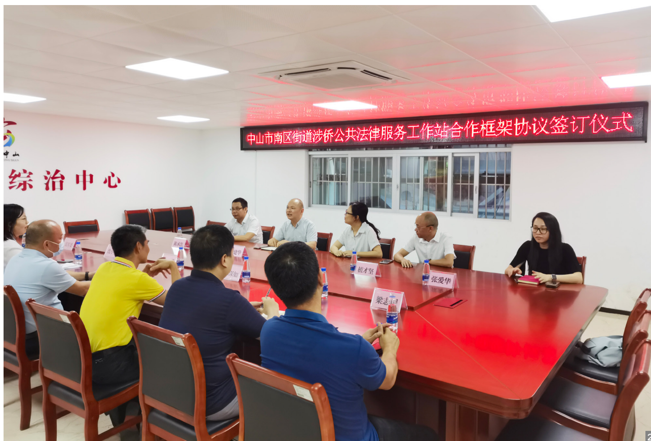
图1 南区街道涉侨公共法律服务工作站正式揭牌