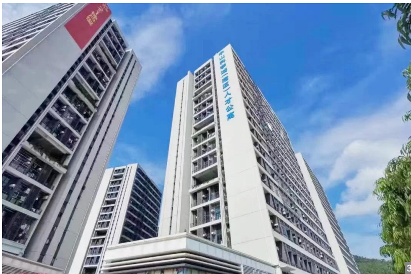
图1 高层次人才向南区街道赠送锦旗