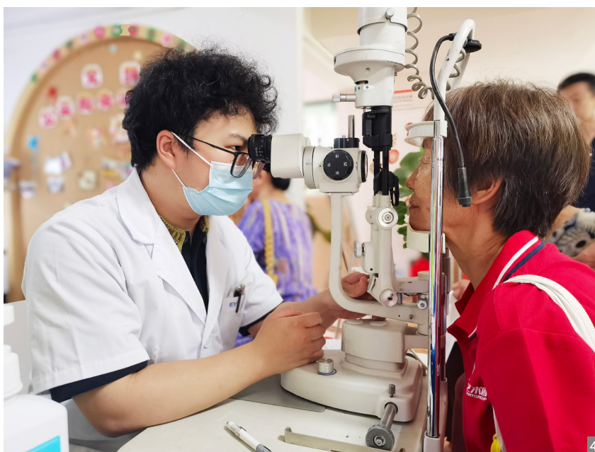
图1 关爱老年人义诊活动现场 图2、3 现场提供量血压服务 图4 为老年人检查视力

In order to improve the health level and quality of life of the elderly, recently, the Nanqu Subdistrict Chengnan Community, in conjunction with Zhongshan Aier Eye Hospital, Zhongshan Aiya Stomatology Hospital, Bellman & Symfon (Zhongshan Branch of Hangzhou Bowen Technology Co., Ltd.) And Zhongshan Tongfang Rehabilitation Hospital, launched a free clinic for the elderly in Milan Sunshine New Era Civilization Practice Station, attracting hundreds of residents.