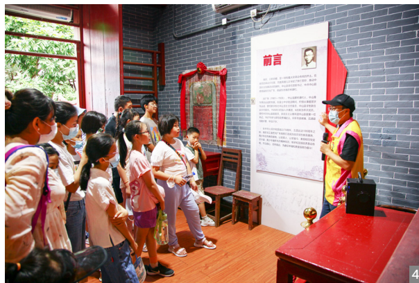
图1 “少年儿童心向党 喜迎二十大”南区街道庆祝“六一”儿童节系列活动现场