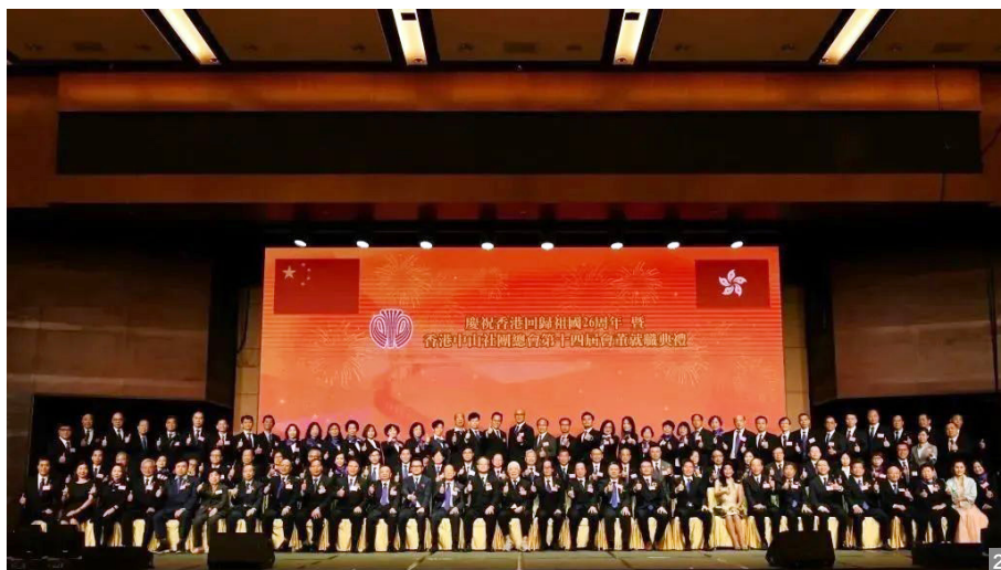
图1、2 香港中山社团总会隆重举行第十四届会董就职典礼