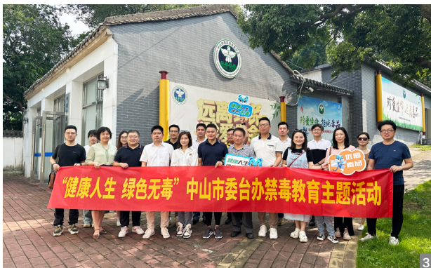
图1、2 青年台胞台属参观青年革命运动先驱刘广生的故居