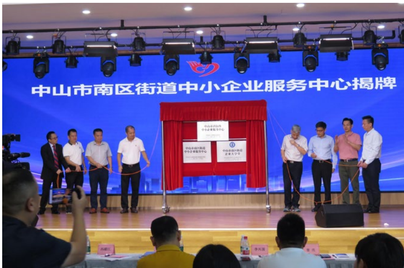
中山市南区街道中小企业服务中心揭牌仪式

Address the Last-mile Problem in Enterprise Services: South District Small and Medium Enterprise Service Center Is Unveiled