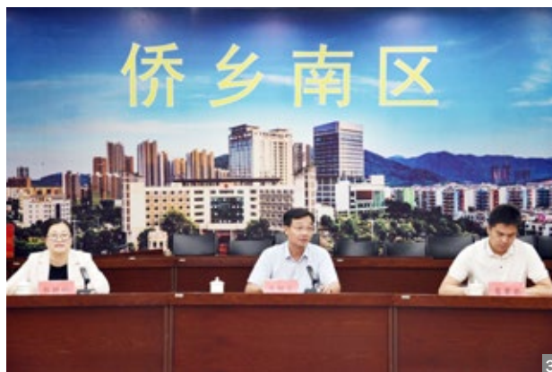
图1 11月9日，澳洲中山同乡会到访南区街道开展交流考察活动