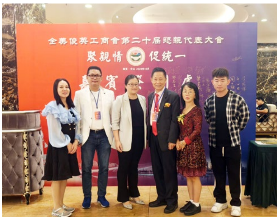
10月19日，南区侨联主席出席全美俊英工商会第二十届恳亲大会