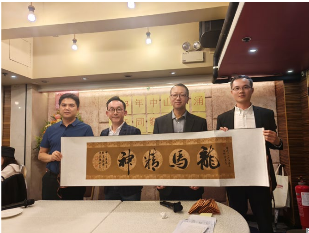
图1、2 香港沙涌马氏同乡会举办2023年度会庆

On December 14, Association of Ma Clansmen of Sar Chung holds the 2023 Annual Celebration and Elderly Dinner. Deputy Secretary of the Party Working Committee of South District Deng Xiao and heads of the General Office of Party and Government Affairs of South District, South District Federation of Returned Overseas Chinese and Sar Chung