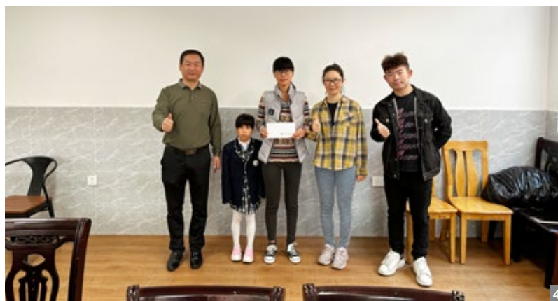
图1、2、3 澳门中山良都同乡会回乡公益助学贫困学生 图4 南区街道体育和教育事务局转交助学金