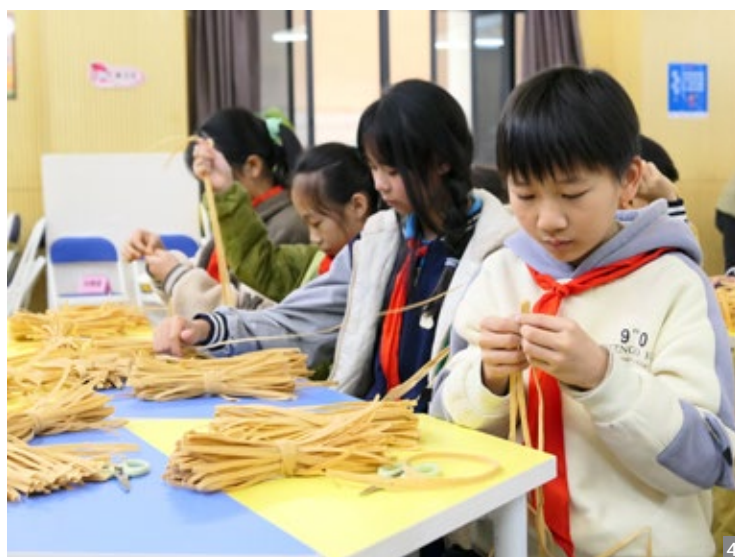
图1 “龙环火龙”文化分享会