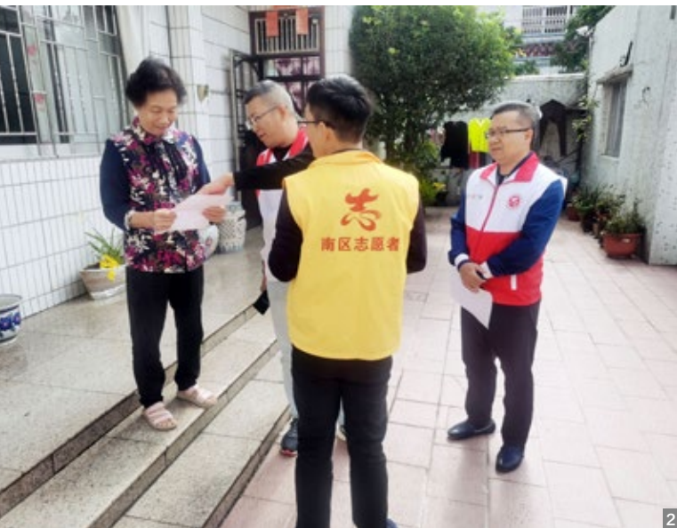
图1 南区街道香山长者饭堂