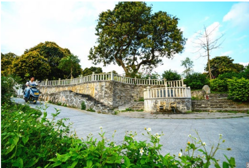
图1 南区街道曹边美景 图2 市委书记郭文海到南区 街道北溪社区曹边走访 图3 曹边龙井

育和传承结合起来，围绕厚植思源文化这一核心理念，进一步挖掘弘扬红色文化、华侨文化、乡土文化，引导群众坚定不移听党话、感党恩、跟党走，为更加美好的生活而努力奋斗。要坚持党建引领基层治理，充分发挥好基层党组织书记“领头雁”作用，广泛汇聚各方面力量，形成人人关心支持、全社会共同参与“百千万工程”的良好氛围。