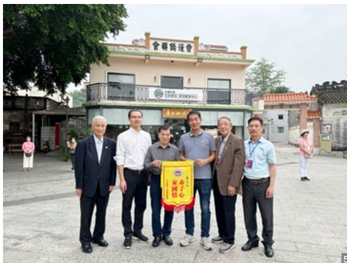
图1、2、3 10月20日全美俊英工商总会到访曹边