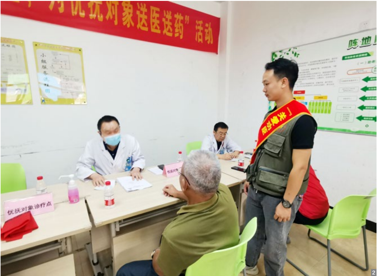
图1、2 10月17日，南区街道退役军人服务中心开展“关爱功臣，送医送药”活动 图3 为优抚对象免费发放备用药

On October 17, the Veterans Service Center of South District launched an activity with the theme of "Caring for the Heroes and Delivering Medical Care and Medicine". Relevant personnel provided home medicine and free medical services for the entitled veterans, taking concrete measures to support the army and families of the army men and fallen heroes. Volunteers patiently explained the medical treatment process to the veterans, guided them to line up for physical examinations and receiving medicine, and communicated the preferential treatment policies to the veterans. During this activity, 27 ex-servicemen, disabled soldiers and veterans in South District received free medicine and medical services.