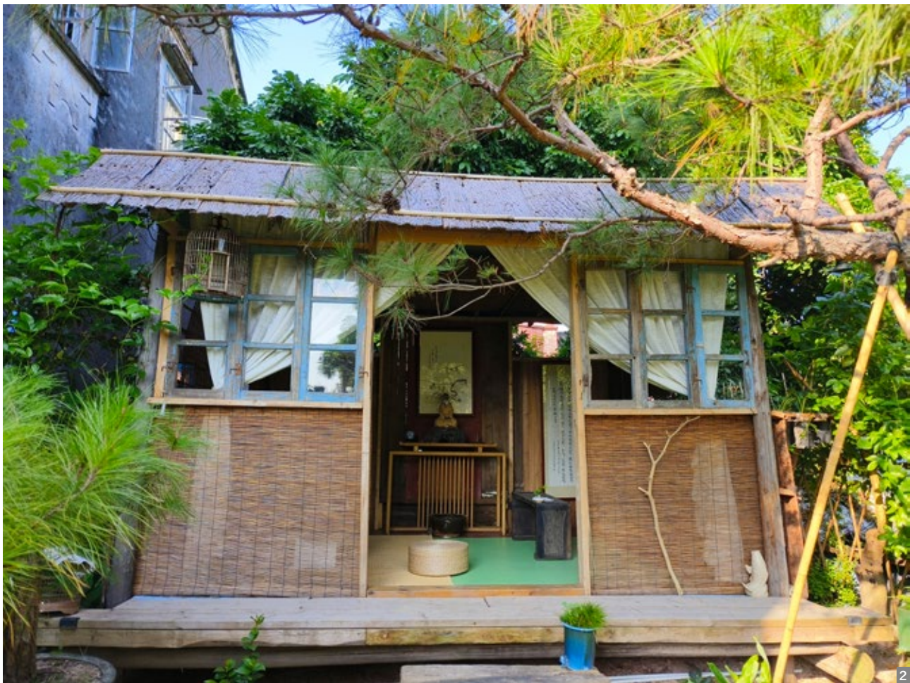
图1 南区街道曹边不舍园