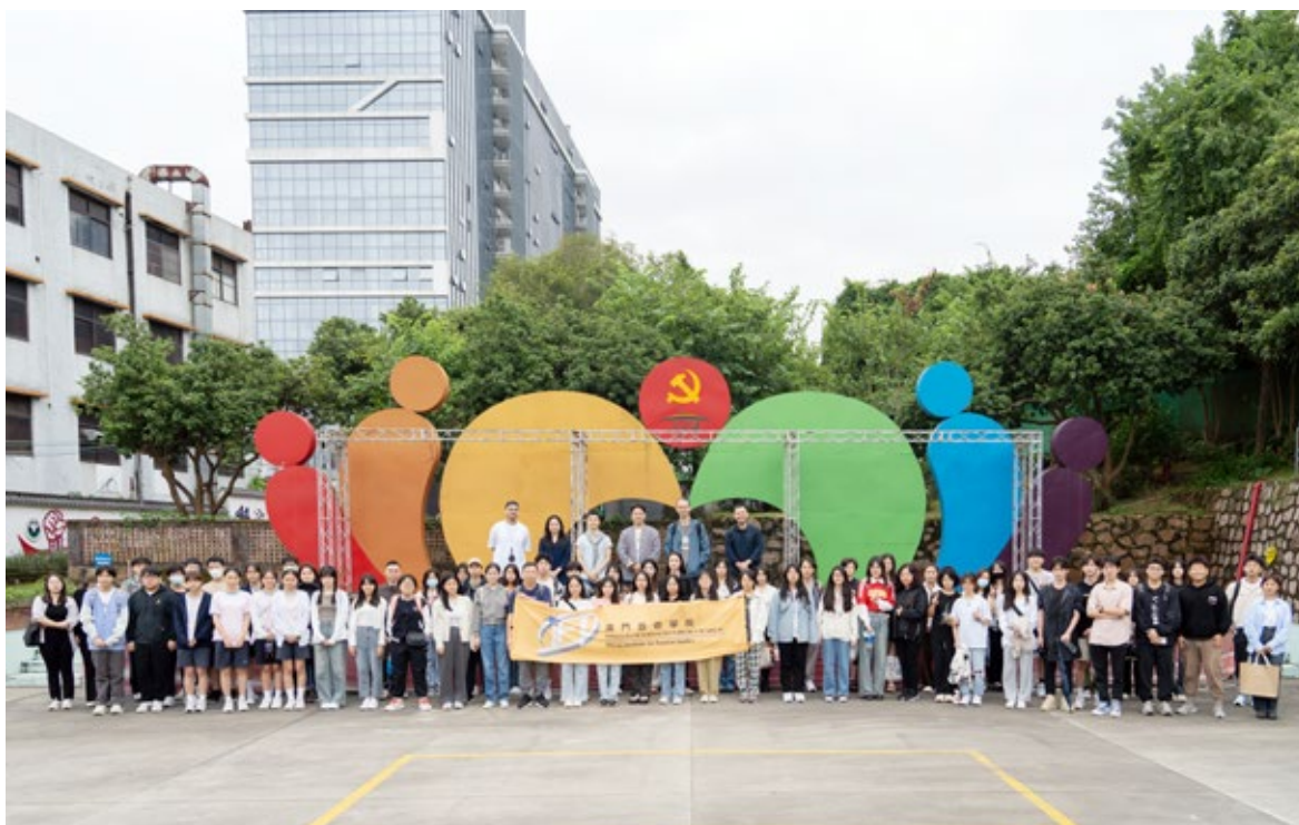
10月21日，澳门旅游学院来访