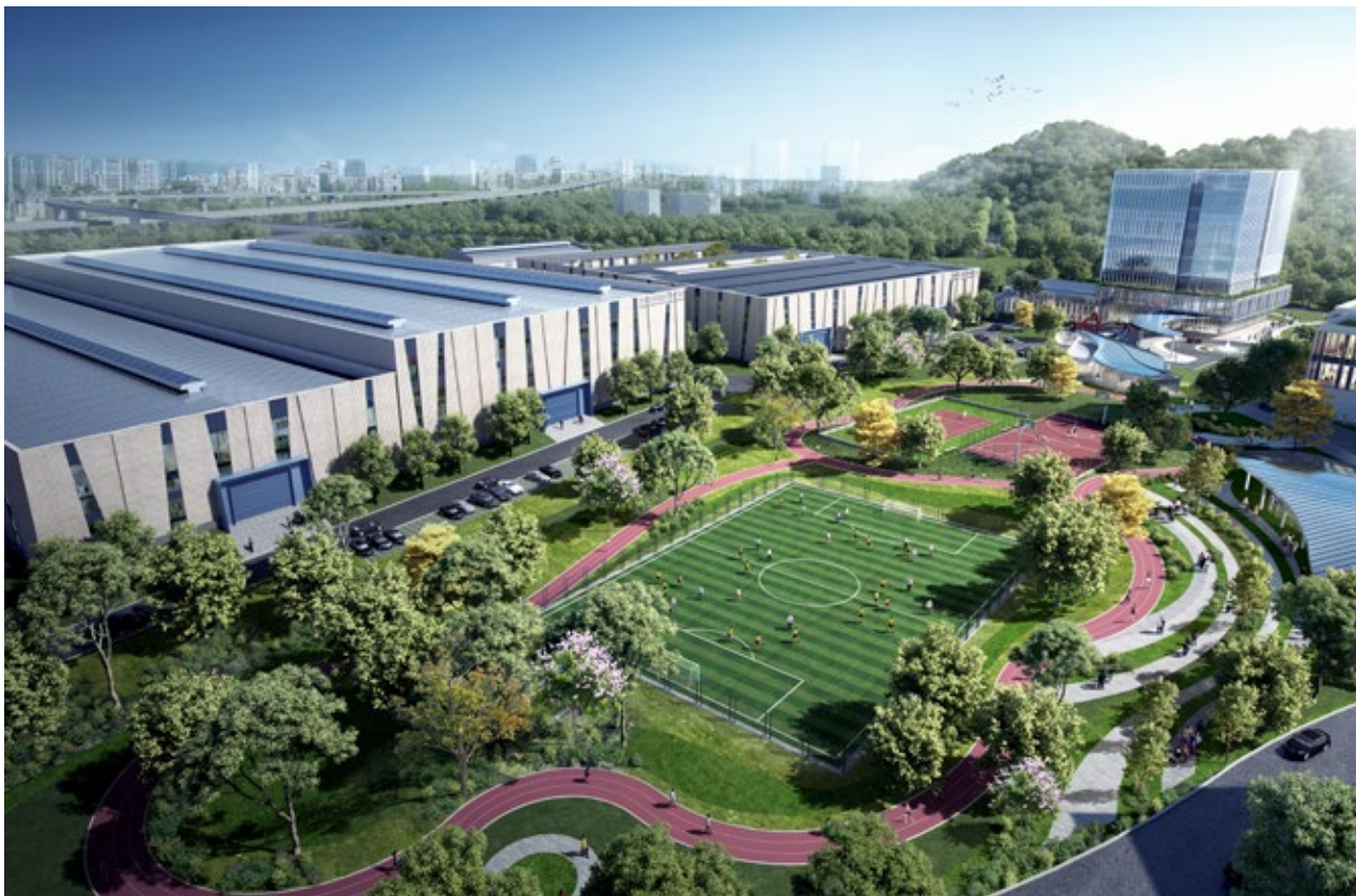
中山先进低温技术研究院效果图

科技任务，包括参与承担中国科学院 C 类战略性先导科技专项、氢资源科技部重大项目等国家课题任务，自主研发液氢制储输用关键技术及示范工程项目，建设国际领先的先进低温技术创新平台、氢技术发展和检测中心。