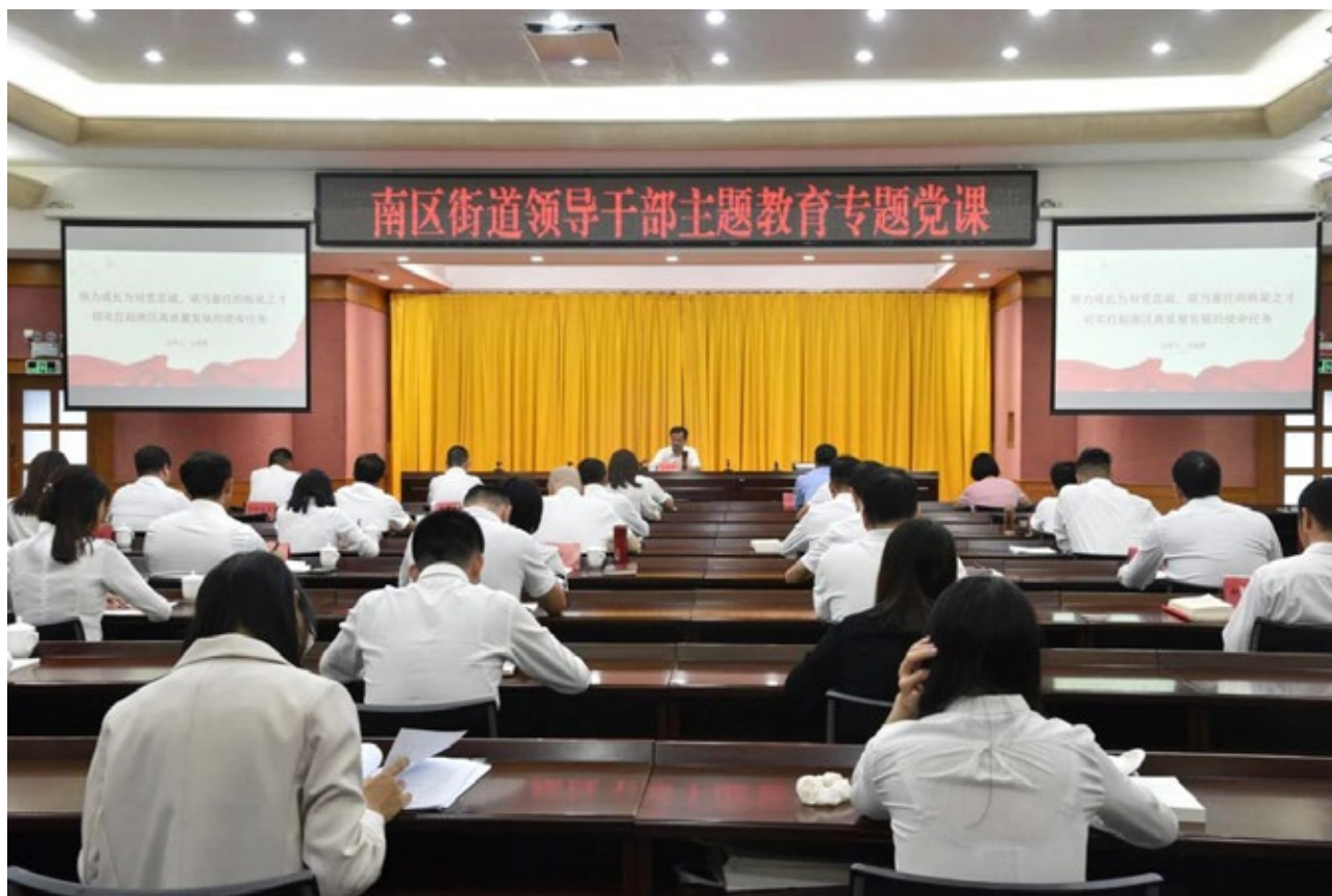
11月7日 南区街道召开领导干部主题教育专题党课

Strive to Become an Essential Talent Who Is Loyal to the Party and Capable of Shouldering Important Tasks and Promoting the High-quality Development of South District