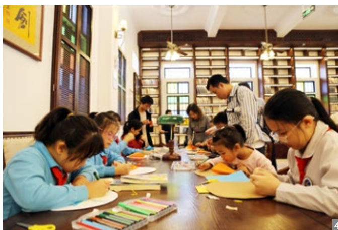
图1 10月21日，沙涌学校（旧址）香山书房开展“金秋情暖 书香重阳”亲子阅读活动