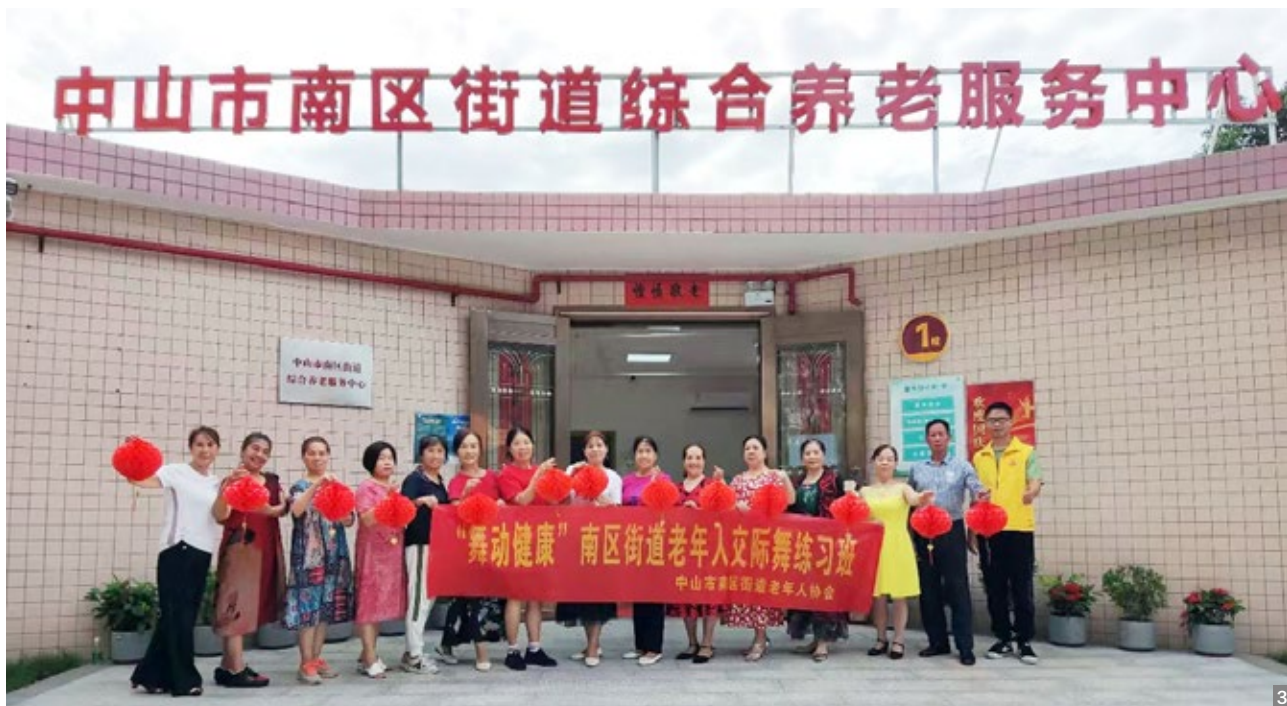
图1、2 2023年重阳节晚宴活动 图3 “舞动健康”老年人交际舞练习班

南区街道公共服务办公室以老年人协会为基础，整合南区街道助老服务资源，将三色长者义工队、兜底服务联络员队伍和博爱义工·志远服务队三支队伍整合为“凝心聚力促养老，暖心服务展风采”南区街道综合养老服务中心志愿服务总队。通过资源、人员、项目的多元整合，持续探索和优化“以老助老”志愿服务模式，秉承“奉献、友爱、互助、进步”的志愿服务精神，鼓励更多低龄老人老有所为，促进队伍的健康发展，为街道老年人提供优质的志愿服务。据不完全统计，三支志愿服务分队累计发布志愿服务活动3500场，志愿服务时间达19000余小时，是南区街道助老服务中的重要力量之一。