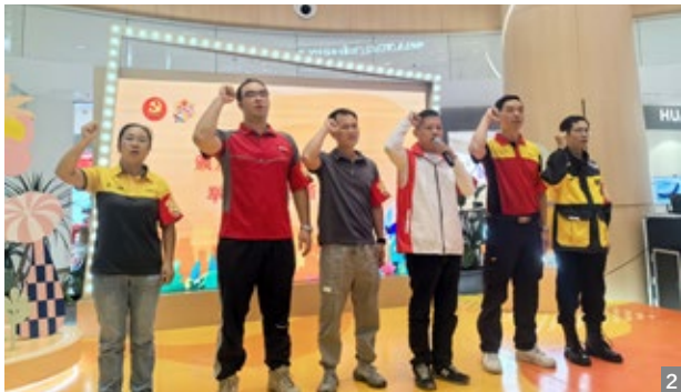
图1、2 11月26日，中山市南区街道在暖“蜂”商圈举行2023年南区街道星级先“蜂”骑手表彰仪式