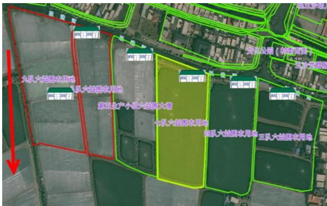
图 2. 位置朝向示意图