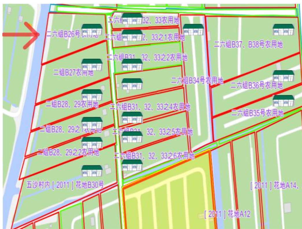
图 2. 位置朝向示意图