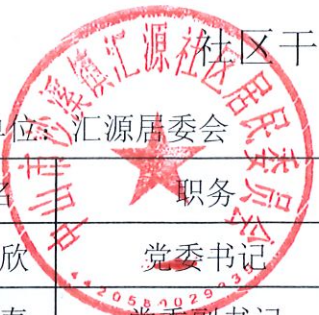
汇源社区干部及社区工作人员待遇补贴情况表