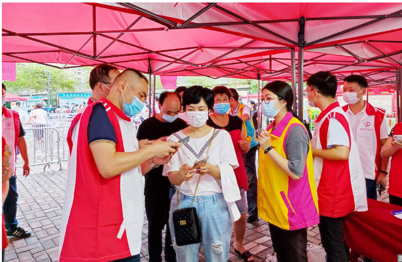
图1 南区街道各单位、部门、社区、经联社干部员工组成的近500名党员志愿者全员出动驻守核酸采样点，和医护人员共同奋战在第一线