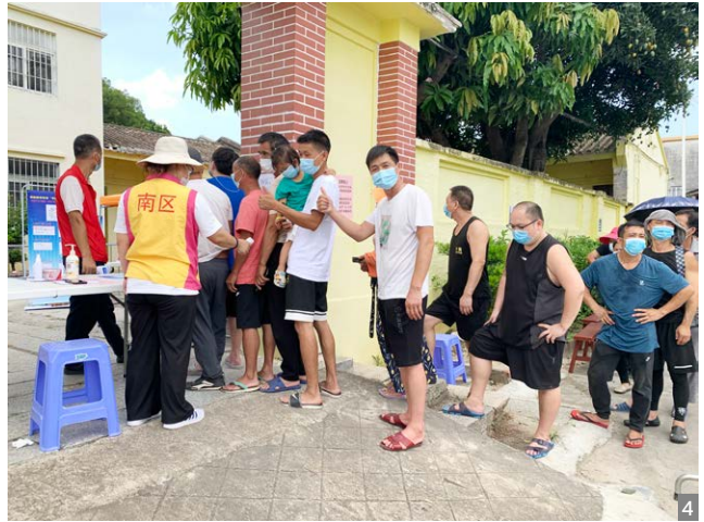
图4 各临时检测点现场井然有序，有条不紊地开展核酸检测工作

After the city issued an urgent notice, South District rapidly researched the arrangement of mass nucleic acid tests. By fully drawing on the work experience of Guangzhou City and surrounding towns/sub-districts, it finally decided to organize a nucleic acid collection in batches region by region upon comprehensive consideration and judgment, taking into account the population distribution of South District, to ensure the orderly advancement of testing. 90,000 permanent residents were all tested without omission.