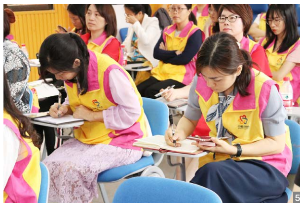
图1 南区街道妇联、南区街道教体文旅局、市家庭教育工作者协会联合举办了“2021年南区街道家庭教育骨干培训班”