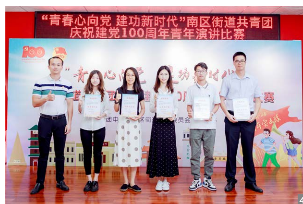
图1 来自机关事业单位、学校、社区及两新组织的等的18名参赛选手