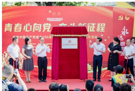
图6 现场还举行庆祝建党一百周年书法活动