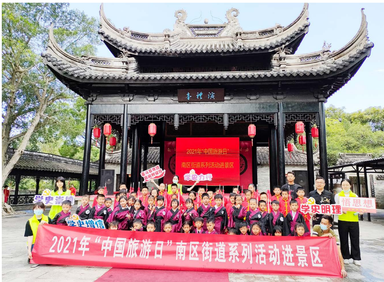
中山詹园开展“中国旅游日进景区”系列活动

为迎接5·19“中国旅游日”，推动旅游服务提质升级，推进文化和旅游融合发展，争创省级全域旅游示范区，5月19日，南区街道AAAA级旅游景区——中山詹园开展2021年“中国旅游日”系列活动进景区，系列活动包括“党史流动学堂”、非遗传承、文明旅游宣传等。