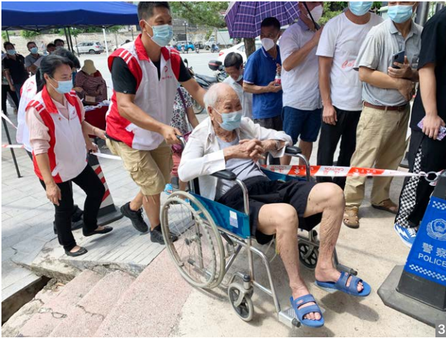
图3 检测点对老弱病残等特殊人群开设绿色通道，做好人文关怀工作