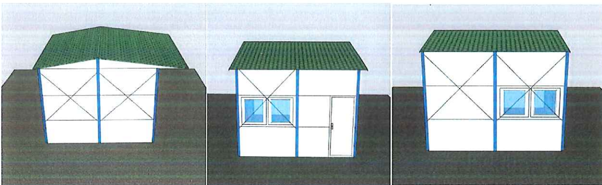
横栏镇田园看护房（工具房）样式示意图