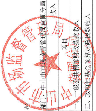
财政拨款收支总体情况决算表