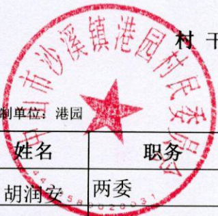
村干部及村工作人员待遇补贴情况表