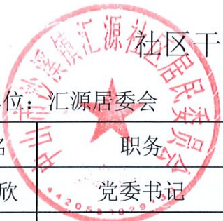
社区干部及社区工作人员待遇补贴情况表