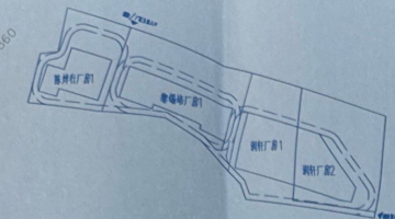
共用厂区消防车道示意图