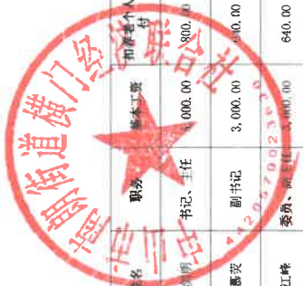
村干部及村工作人员待遇补贴情况表