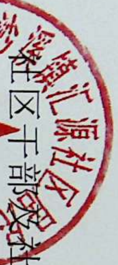
汇源社区工作人员待遇补贴情况表