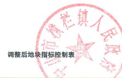
调整后地块指标控制表