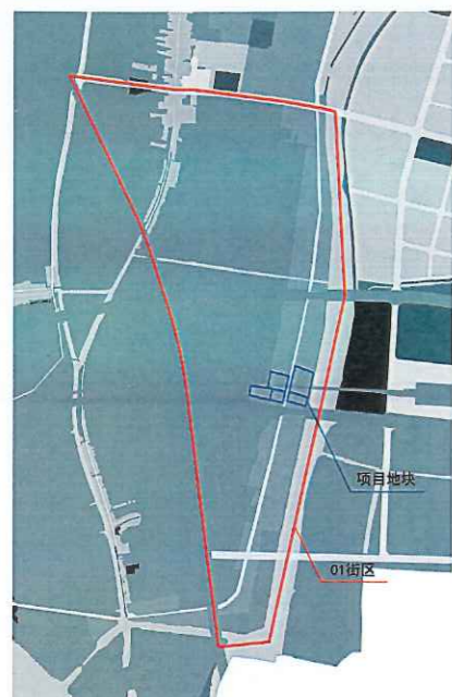
项目地块在1011单元01街区的区位情况