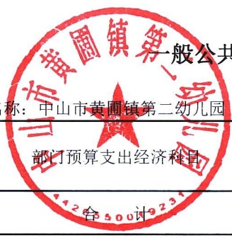
一般公共预算项目支出情况表（按经济分类科目）