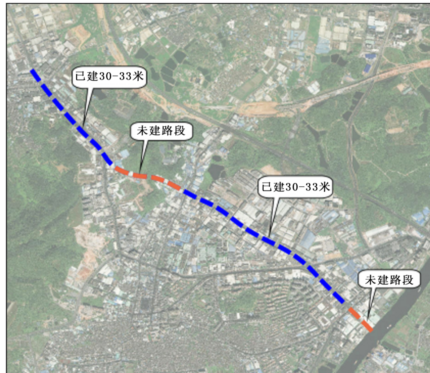
现状横涌路（兴涌东路至隆盛路段）及石岐河大桥建设情况

横涌路是大涌镇对外交通的重要通道之一，横涌路（兴华路段、葵朗路至新平路段）以及石岐河大桥（新平路段）现状已建道路宽度为30米至33米，道路两侧为工业厂房、零售展厅为主建筑；其余路段未建设。