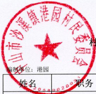
村干部及村工作人员待遇补贴情况表