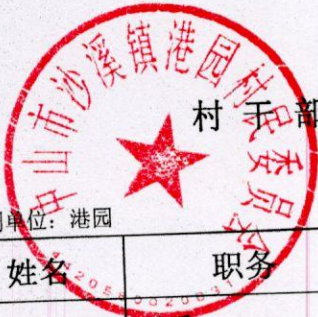
村干部及村工作人员待遇补贴情况表