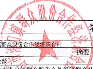
表4 现金收支明细公布表