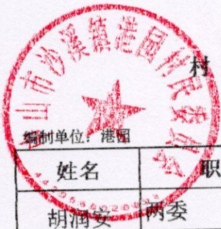
村干部及村工作人员待遇补贴情况表