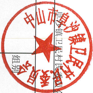
农资综合直补资金分配情况表