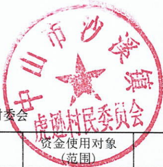
政府拨款使用管理情况明细表