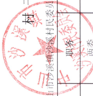
村干部及村工作人员待遇补贴情况表