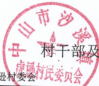
村干部及村工作人员待遇补贴情况表