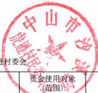
政府拨款使用管理情况明细表