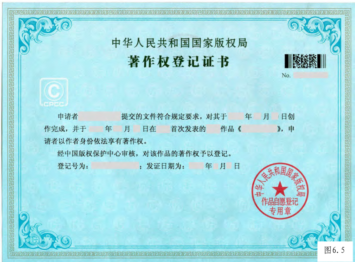
图 6. 5