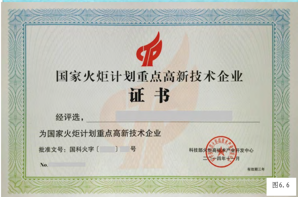
图 6. 6