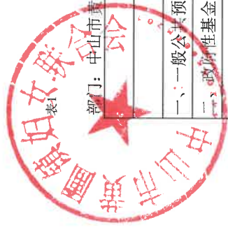
部门收支总体情况决算表