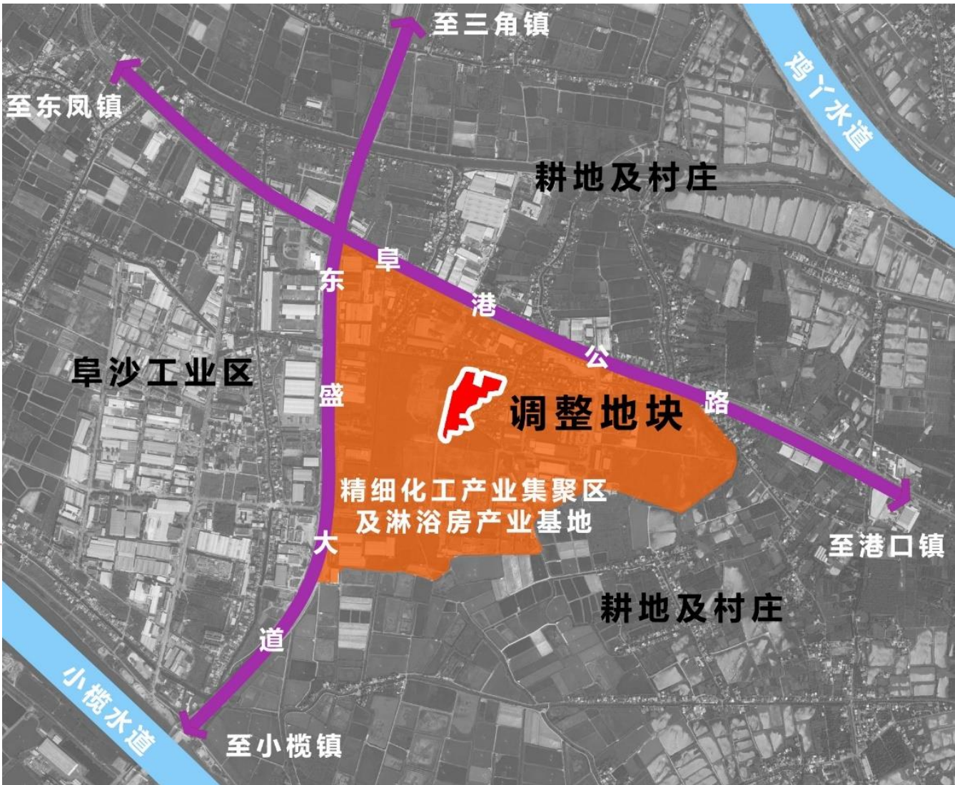
调整地块在片区的位置示意图（航拍）