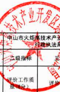
中山市2020年度火炬区财政支出项目绩效核查评分意见表