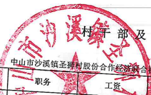
圣狮村干部及村工作人员待遇补贴情况表