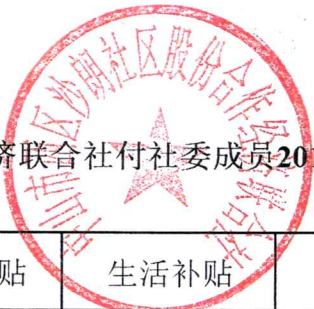
沙朗社区股份合作经济联合社付社委成员2019年12月工资及生活补贴签收表