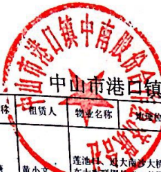
中山市港口镇中南股份合作经济联合社集体物业出租登记表 (2019年)