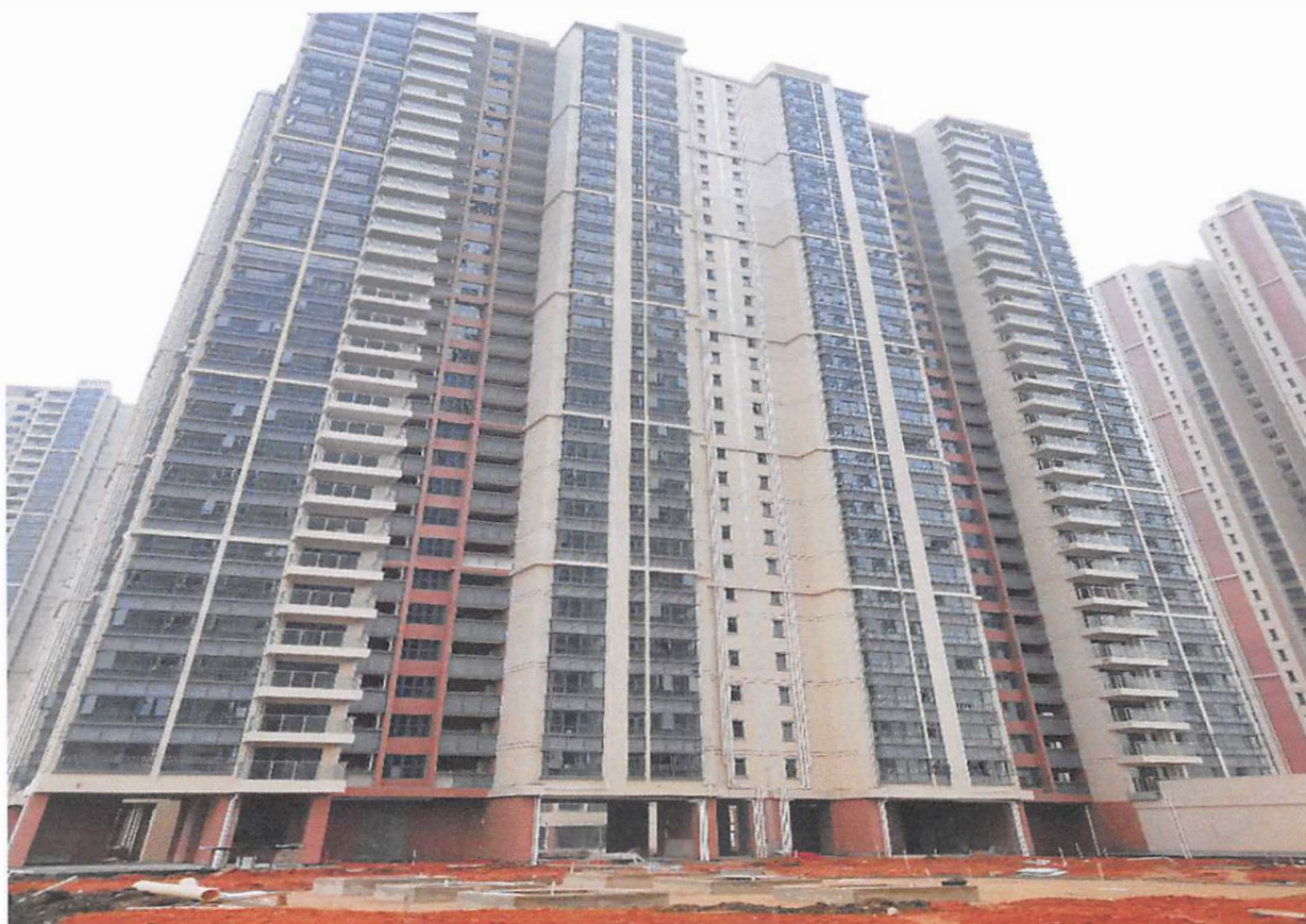
5 栋、6 栋（电梯前室装修基本完成，栏杆玻璃安装基本完成）