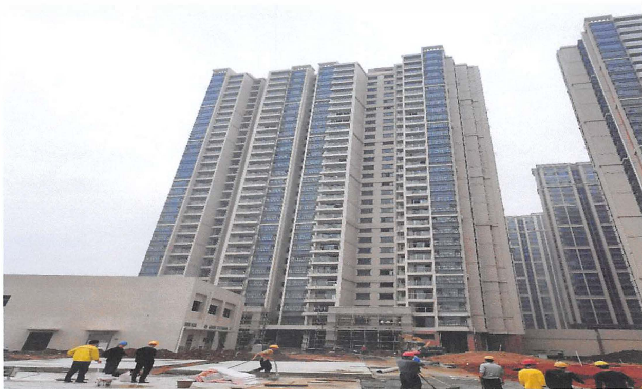
1 栋、 2 栋(电梯前室装修基本完成；栏杆玻璃安装基本完成)