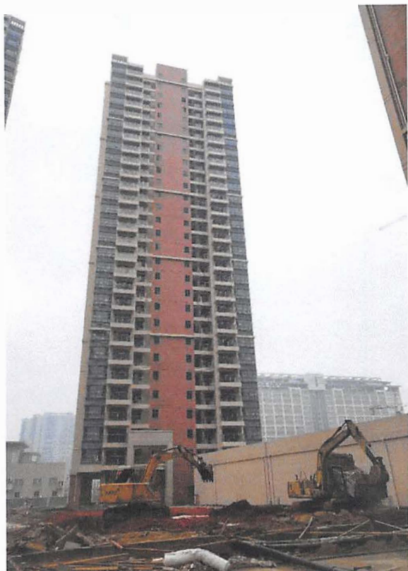
9 栋（前室装修基本完成，栏杆玻璃收尾中）