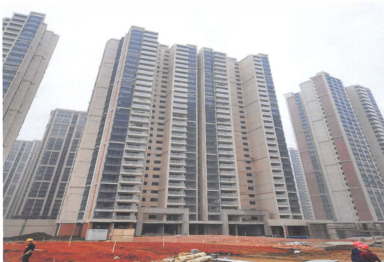
3 栋、4 栋（电梯前室装修基本完成，栏杆玻璃安装基本完成）