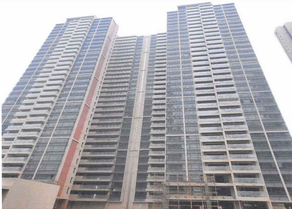
10 栋、11 栋（电梯前室装修基本完成，栏杆玻璃安装基本完成）