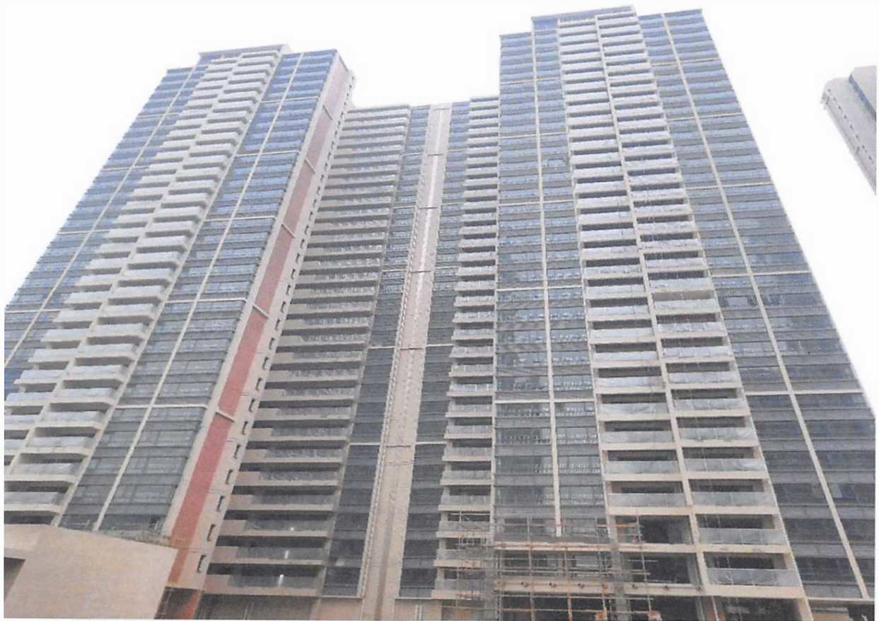
14 栋、15 栋（电梯前室装修基本完成，栏杆玻璃安装基本完成）