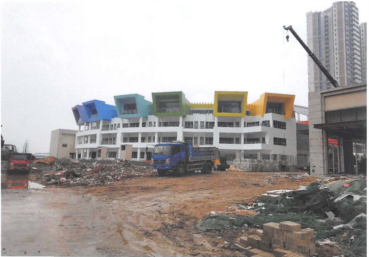
幼儿园：剩余部分装修收尾中。