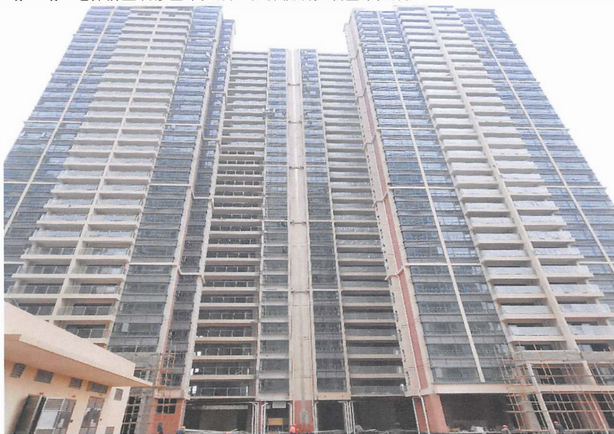
7 栋、8 栋（电梯前室装修基本完成，7 栋栏杆玻璃部分收尾中，8 栋栏杆玻璃安装完成）