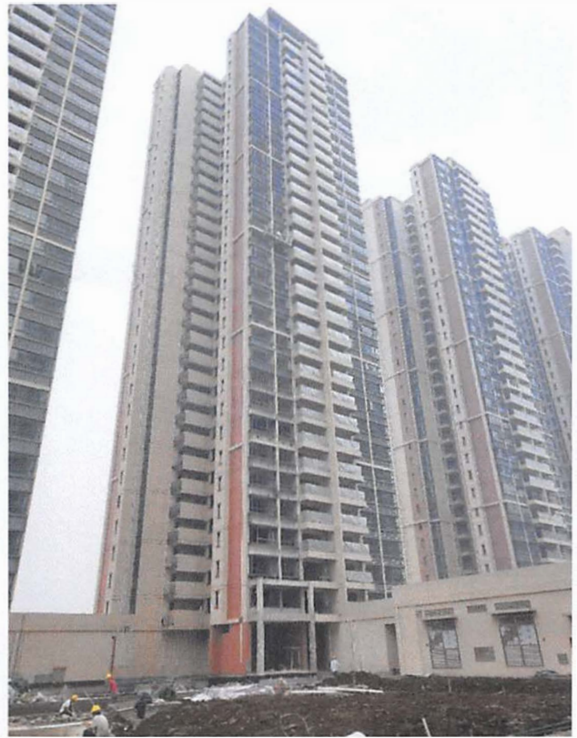
13 栋（前室装修基本完成，栏杆玻璃基本完成）16 栋（前室装修基本完成，栏杆玻璃收尾中）