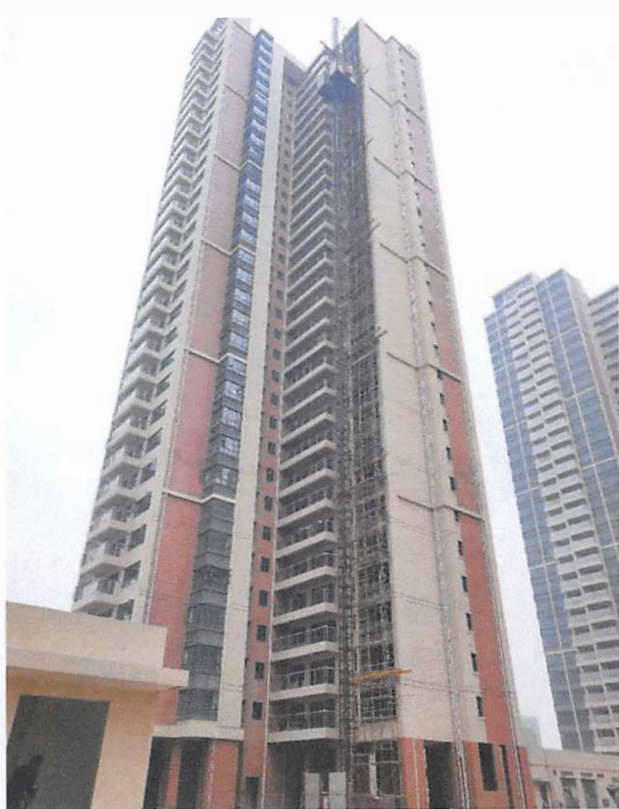
12 栋（前室装修基本完成，栏杆玻璃安装基本完成）