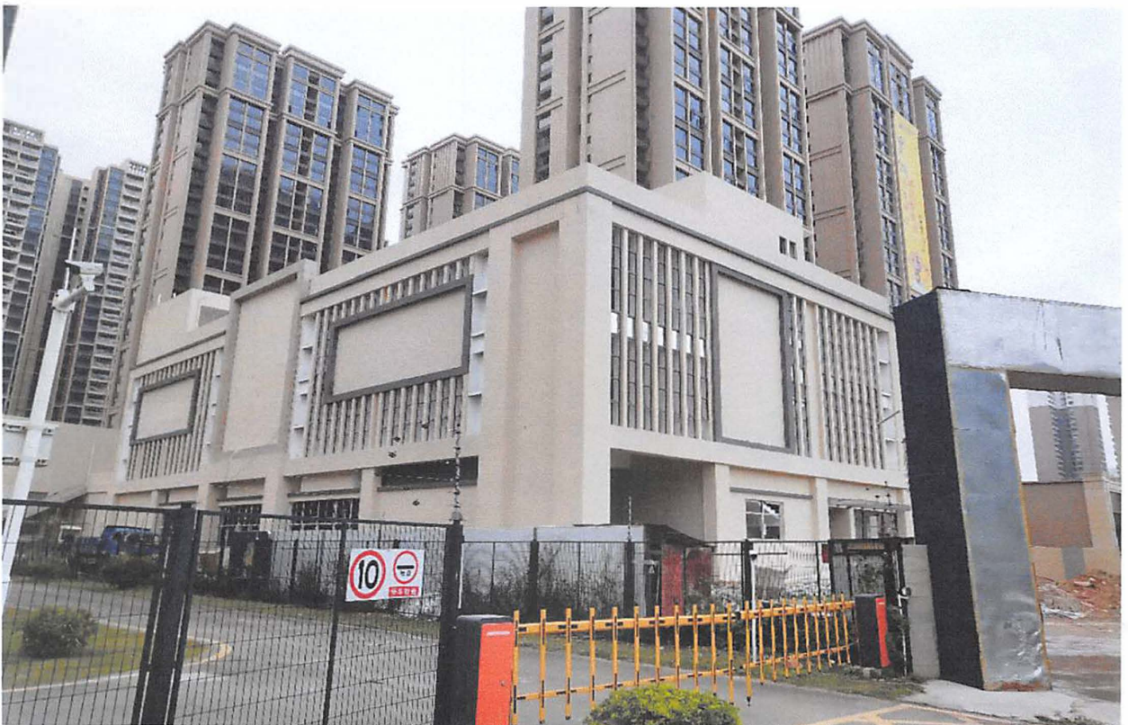
综合楼：外墙砖粘贴基本完成，刮腻子基本完成，楼层找平基本完成，剩余部分收尾工作。