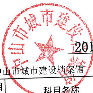
2015 年基本支出预算表 （按功能分类科目）